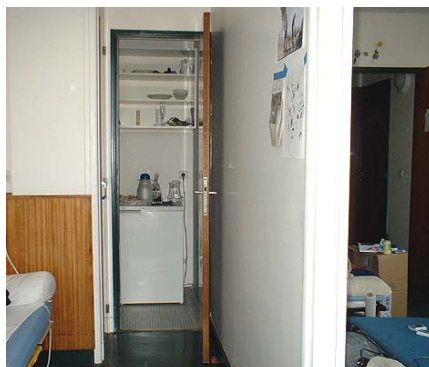
Schlafcke, im Hintergrund die Küche

Das Atelier ist mit allem Notwendigen ausgestattet und verfügt über einen Festnetz-Telefonanschluss.